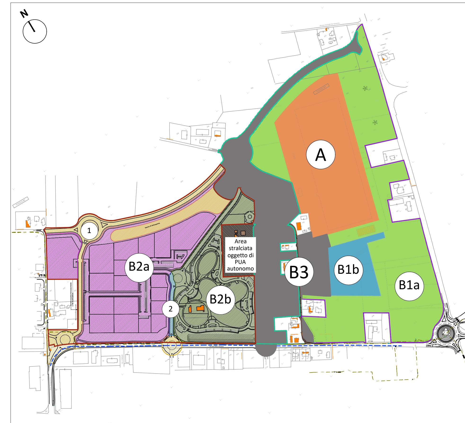
Scheda PRG 174 "Area Colombarina" Individuazione Stralci Funzionali Autonomi e blocchi realizzativi all'interno del Sub Comparto B2 oggetto del presente PUA